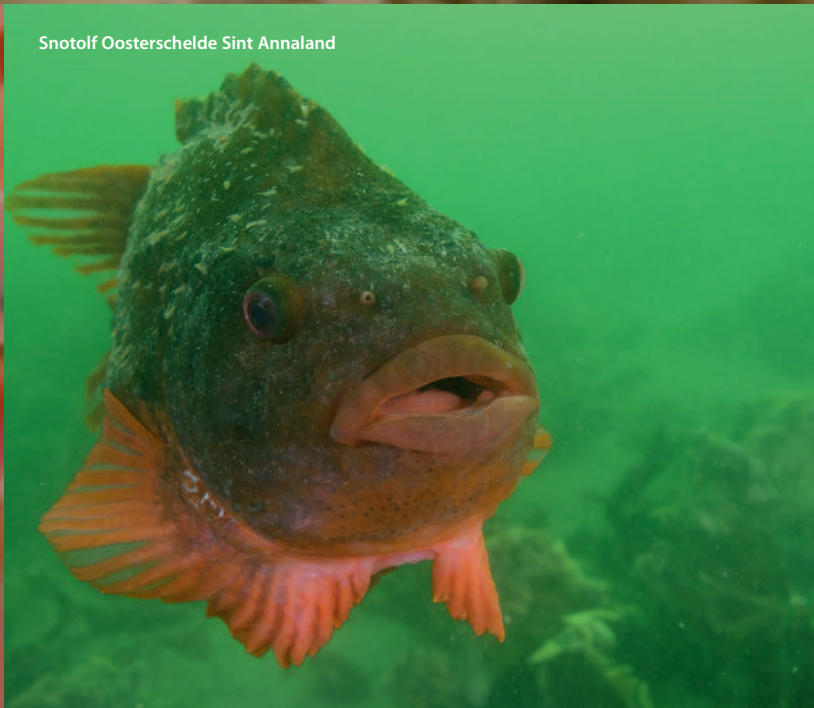
Snotolf Oosterschelde Sint Annaland