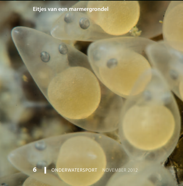
Eitjes van een marmmergrondel