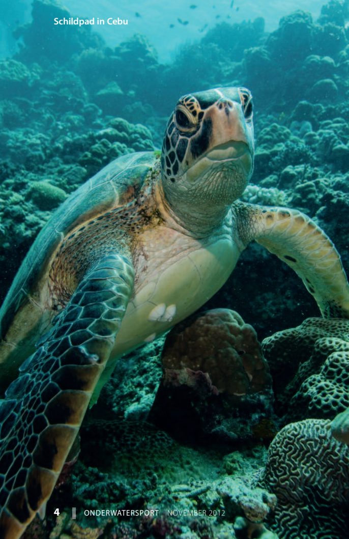
Schildpad in Cebu