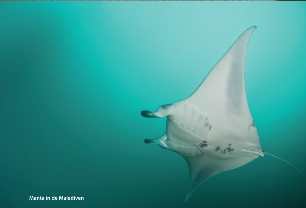
Manta in de Malediven