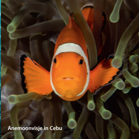
Anemoonvisje in Cebu