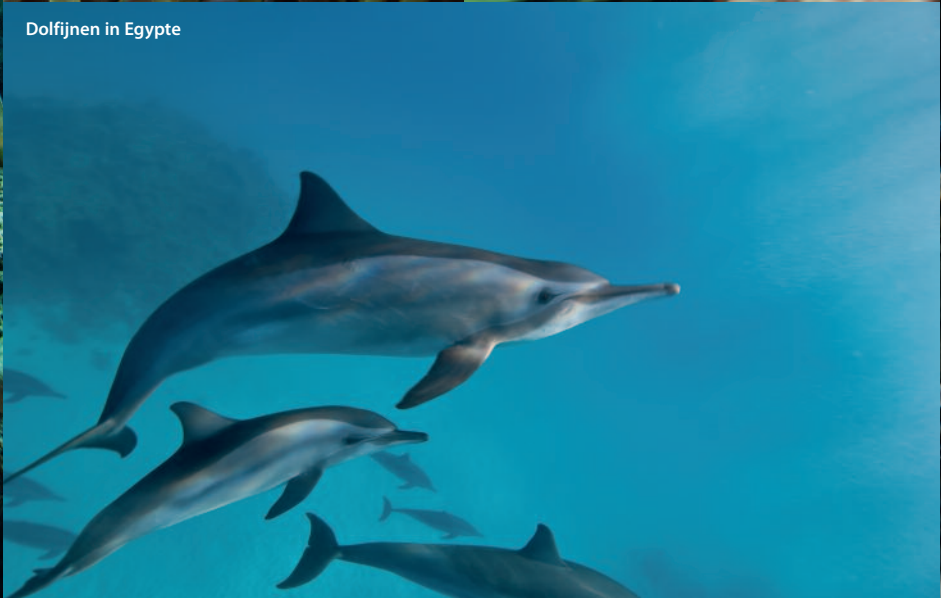
Dolfijnen in Egypte