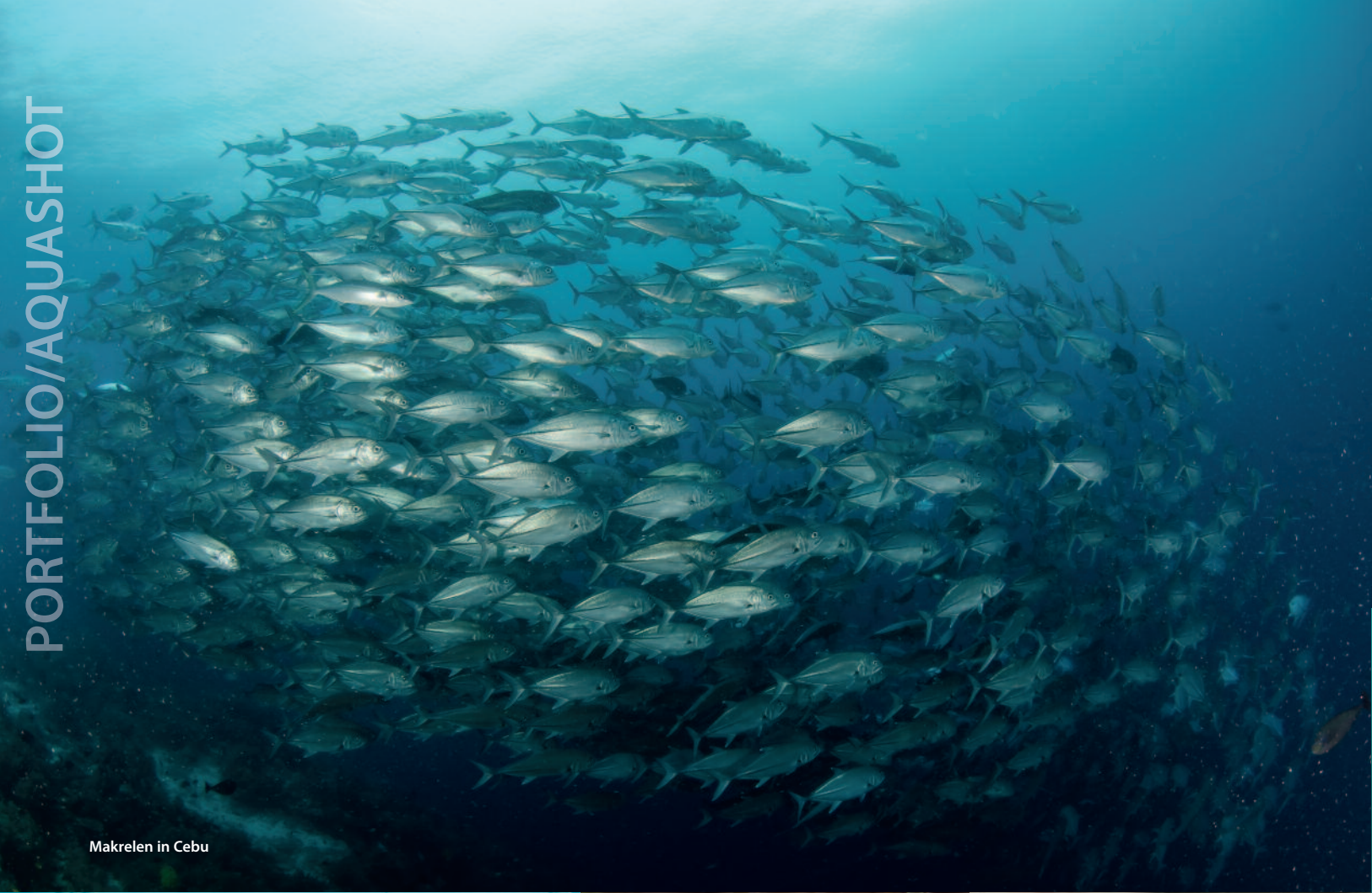
Makrelen in Cebu