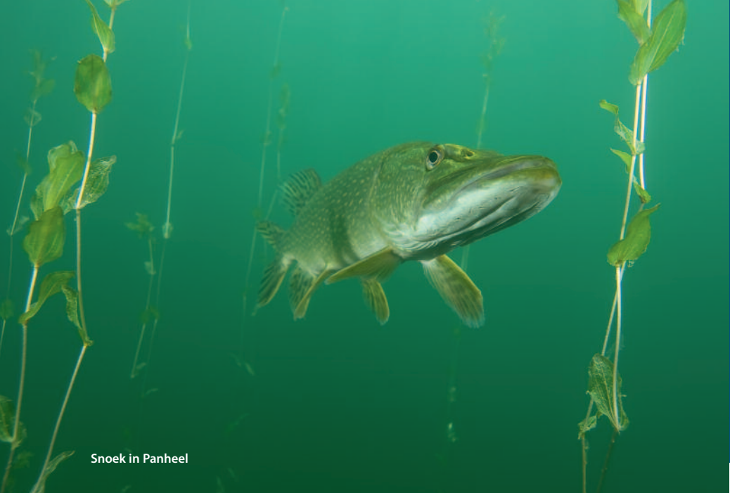
Snoek in Panheel