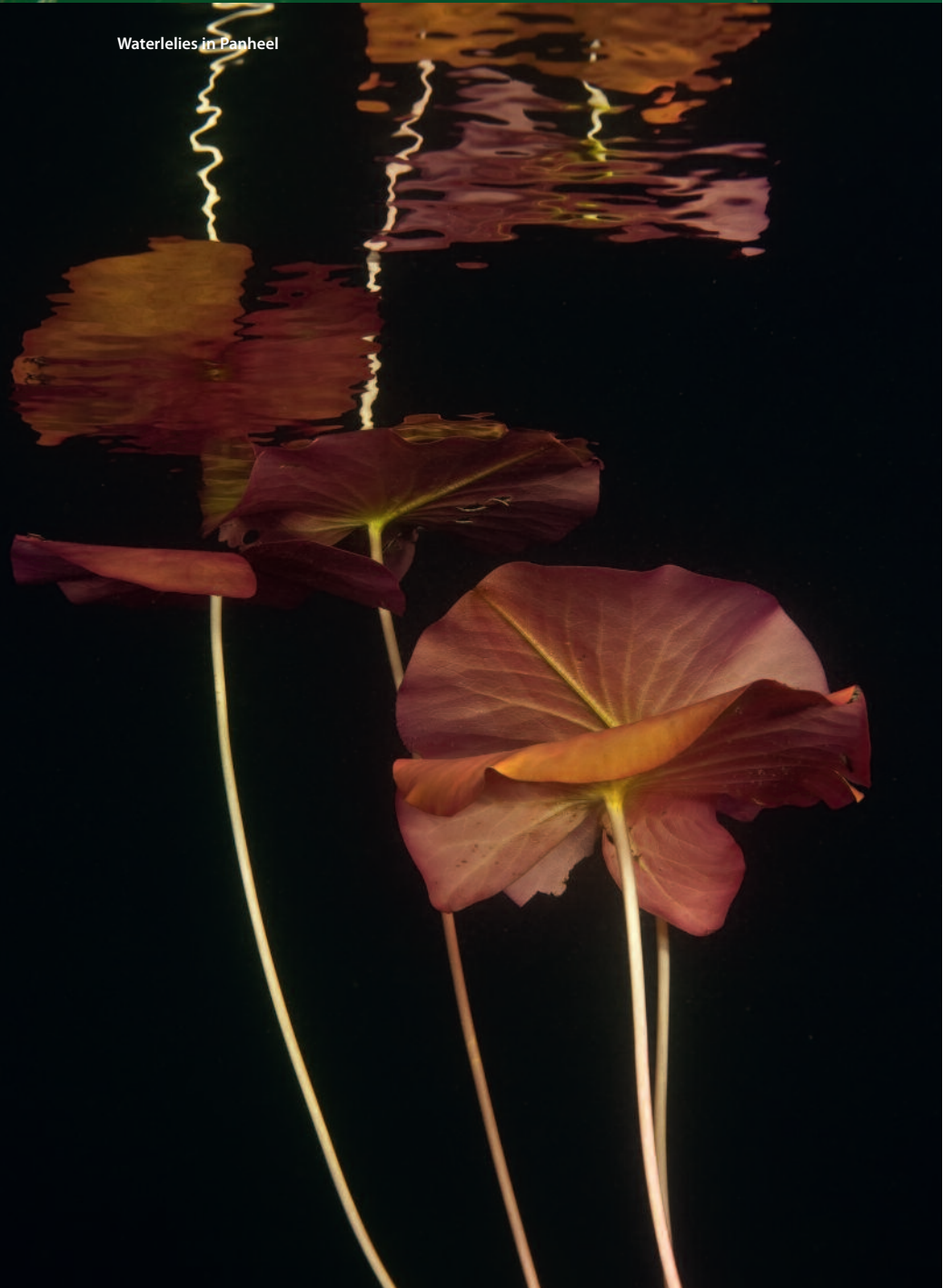
Waterlelies in Panheel