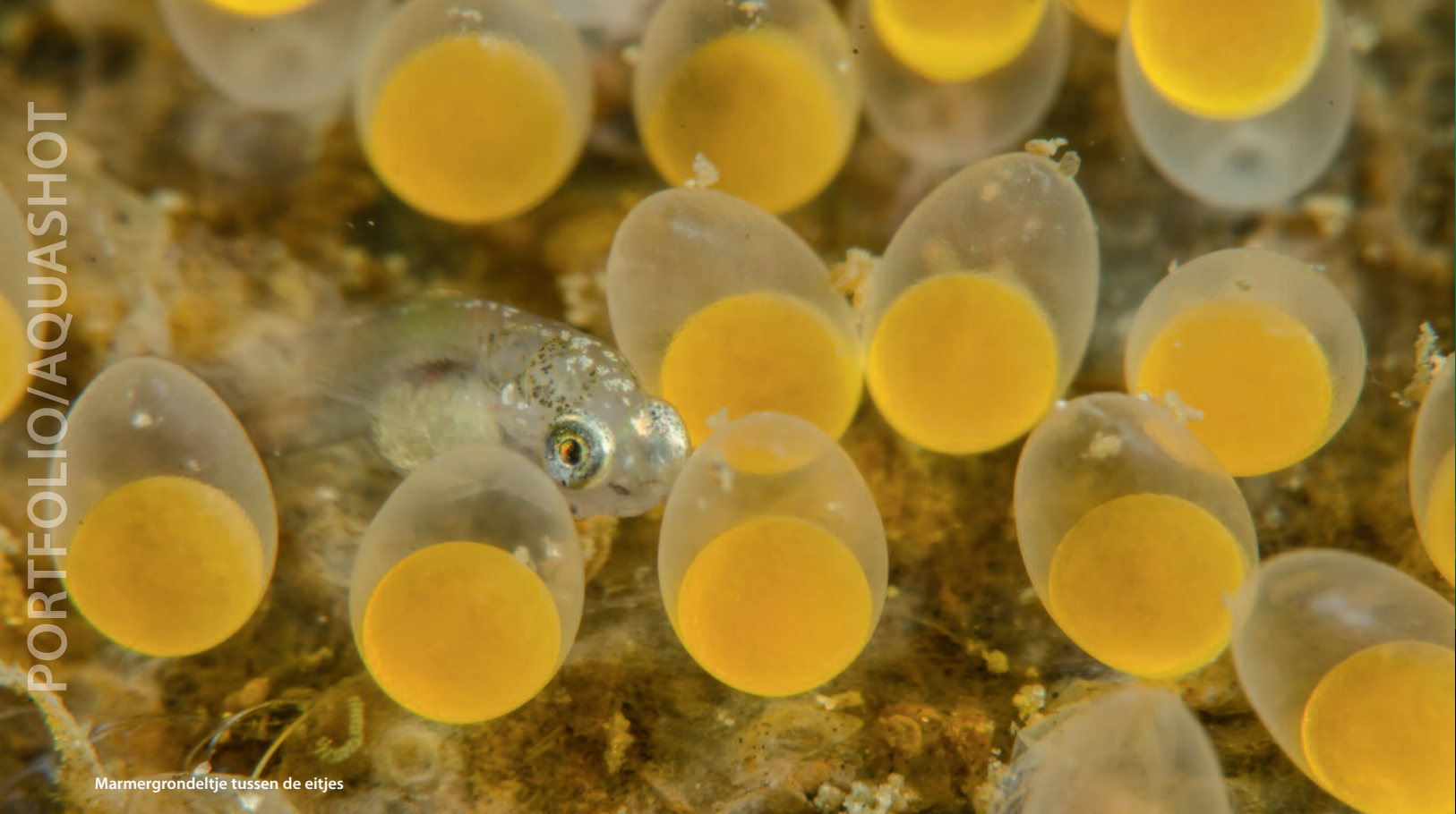
Marmmergrondeltje tussen de eitjes