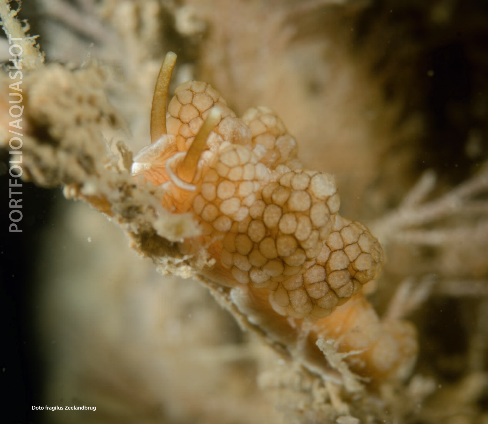
Doto fragilis Zeelandbrug