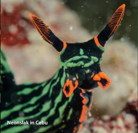
Neonslak in Cebu