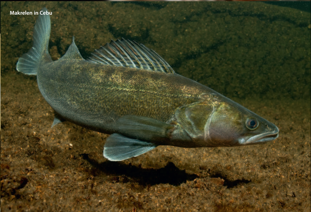
Makrelen in Cebu