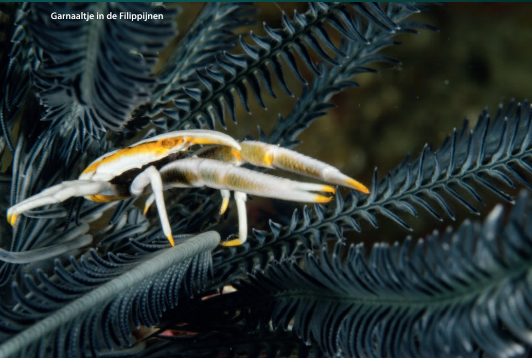
Garnaaltje in de Filippijnen