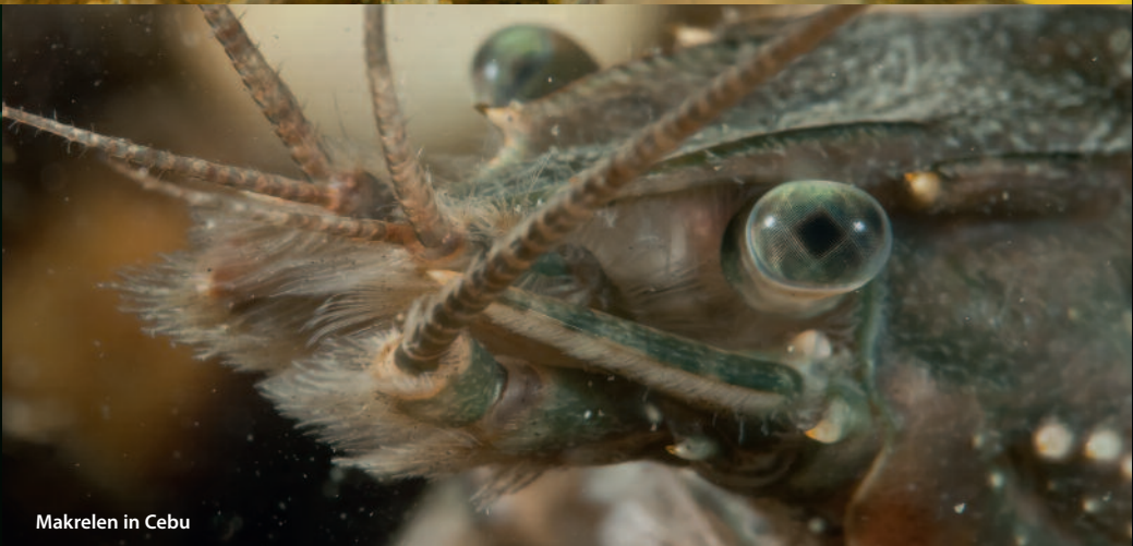
Makrelen in Cebu