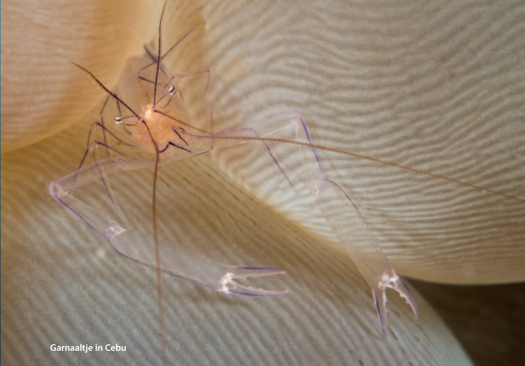
Garnaaltje in Cebu