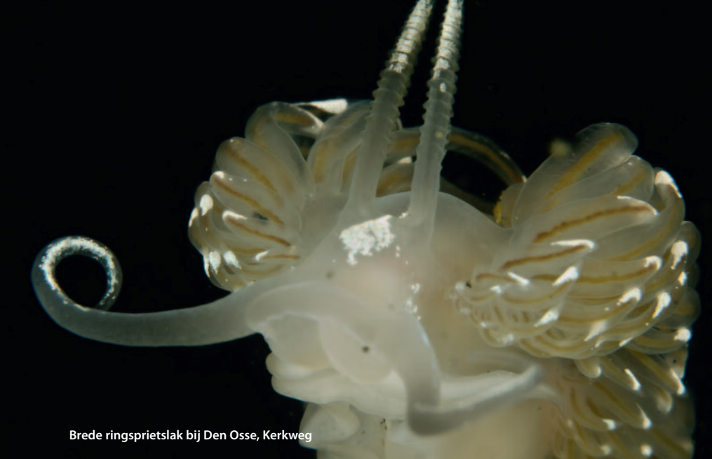
Brede ringsprietslak bij Den Osse, Kerkweg